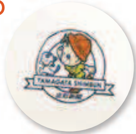
キャラクタータオル

クロスワードパズルの 正解者の中から 抽選で20名様に、 「山新キャラクター タオル(1枚)」を プレゼントします。